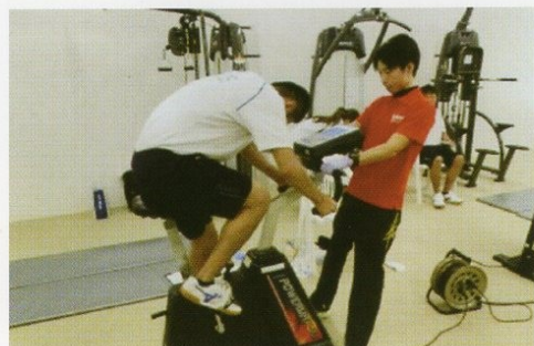
スポーツ科学計測