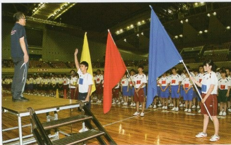
体育祭（北・西合同）